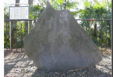
「さくら折るべからず」と刻まれた桜樹接樹碑 1851年建立