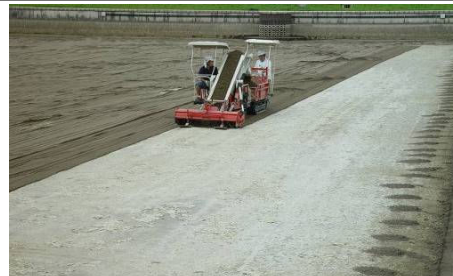
浄水場・ろ過池の砂は表面を定期的に削り取り洗浄される