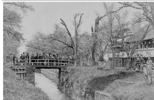
「明治期写真帳」 小金井橋を望む 名勝小金井 桜絵巻より